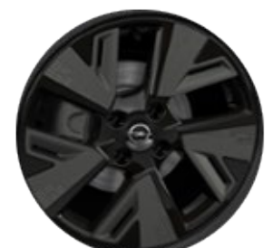
Llanta aleación 17" - 5 radios Negras