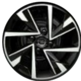
Llanta aleación 16" - 8 radios Tornado Black diamantadas