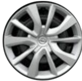
Llanta de acero 16" con embellecedor plateado