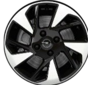
Llanta aleación 16" - 5 radios Negras diamantadas