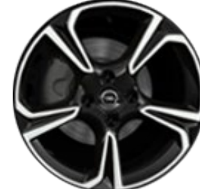
Llanta aleación 17" - 5 radios dobles Negro brillante diamantadas